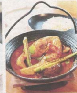
The Norwegian Salmon Asam Pedas is prepared with chilli paste, tamarind and ladies' fingers.