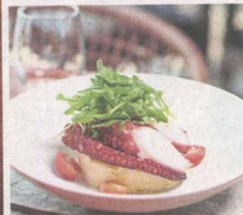
Octopus Salad with Asian Salsa Verde, Rocket Salad and Cherry Tomatoes.