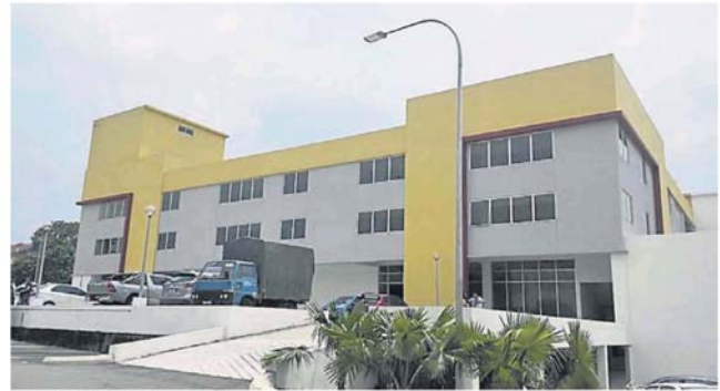
拖延 8 年的皇冠城中环，料在明年初启用。

耗资千多万令吉的蕉赖皇冠城中环工程，是由加影市议会与私人发展商联营，工程拖延长达 8 年，如今已完成 90%。