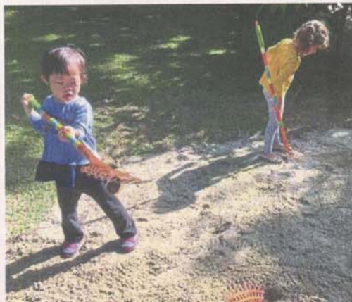
An ideal inclusive society will ensure special needs children and normal children are able to learn in the same space.