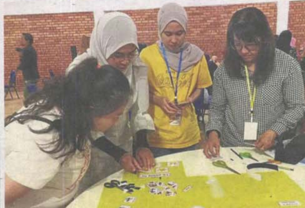
The Selangor Action Council for the Disabled consists of representatives from the disabled group, other stakeholders and government agencies.