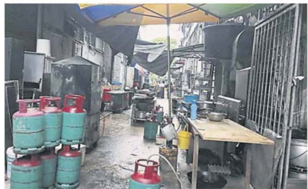
加影市议会限期明年 4 月杪完成整顿双溪龙后巷的工作，避免继续出现霸占后巷的问题。

业者郭赞宝说，店面空间有限，他们才在后巷运作，单是厨房部位就占了半间店，希望可让业者在后巷洗碗碟，并认同业者应照顾清洁卫生。