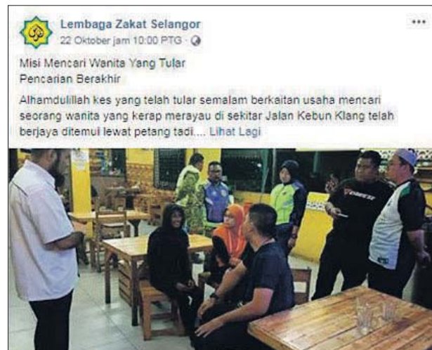
LZS memaklumkan usaha menemukan wanita tersebut berjaya dengan bantuan netizen yang membantu menyampaikan maklumat.

“Pihak kami terpaksa menghubungi polis untuk membawanya ke Hospital Klang, kemudian pihak hospital maklumkan wanita itu sudah menghilangkan diri,” katanya.