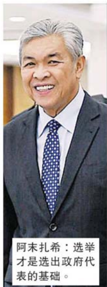
阿末扎希：选举才是选出政府代表的基础。