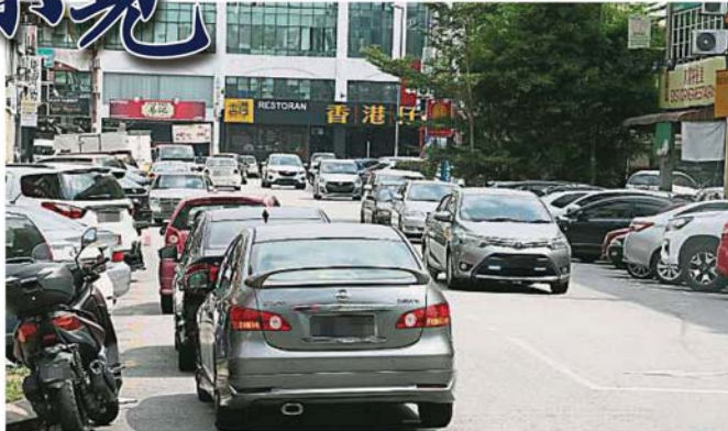
尽管梳邦再也市议会新成立脚车执法队，但蒲种公主城仍未见执法队的踪影，而且双重泊车情况还是一样严重。

不过，《大都会》社区报记者早前前往蒲种公主城第一区及第二区巡视时，未见脚车执法队的官员在该区巡逻，受访民众也表示对新成立的脚车执法队的事宜毫不知情。