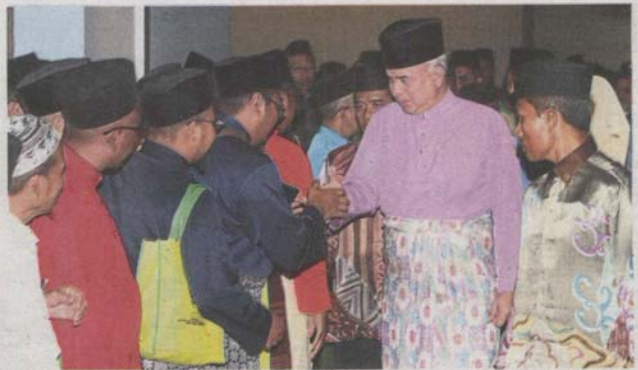
Peoples' ruler: Delegates of the kariah committee conference greeting Sultan Nazrin in Ipoh.

"Lately, these groups have used some non-political and non-governmental organisations to penetrate the mosques and introduce