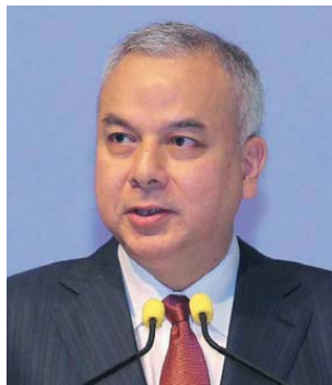
Sultan Nazrin says the enemies with the greatest potential to tarnish the mosques are those with excessive divisive political activities.

also recalled the history behind the construction of several prominent mosques in Perak, including: the Ubudiah Mosque in Kuala Kangsar, recognised among the five most