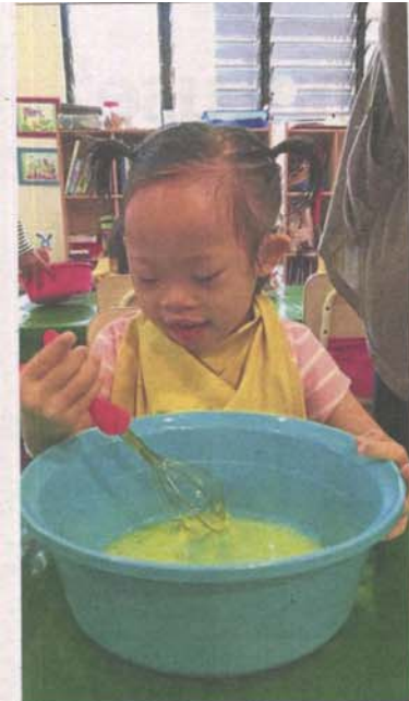
The curriculum in Early Intervention Programmes (EIP) has activities that cover motor skills and life skills for pre-school pupils with special needs.

Provided for client's internal research purposes only. May not be further copied, distributed, sold or published in any form without the prior consent of the copyright owner.