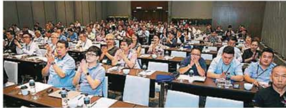
2019年世华数码趋势论坛吸引300名科技人、商家、企业家踊跃出席。