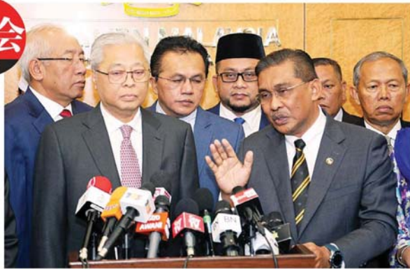
达基尤丁：浮罗交怡有伊党的 18 票。