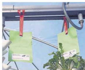
▲ 植物被标示各项说明, 其中包括“采摘”抑或“修剪”, 采摘植物可再生, 修剪植物则需重新种植。

“按我自制系统, 一个 800 平方公尺的范围内, 就可种植 5400 棵菜, 同时, 利用 7 公吨的水来养殖 500 条非洲鱼, 以此类推, 我也可按空间、生产量等来安装所需的种植系统。”