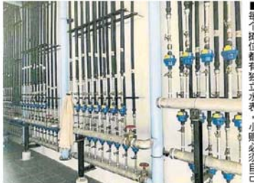
每个摊位都有独立水表, 小贩必须自己负担水电费。

她说, 新巴刹虽然是市议会的公共巴刹, 但会交由建筑物业主管理, 只有底楼是湿巴刹, 2楼和3楼是私人产业。