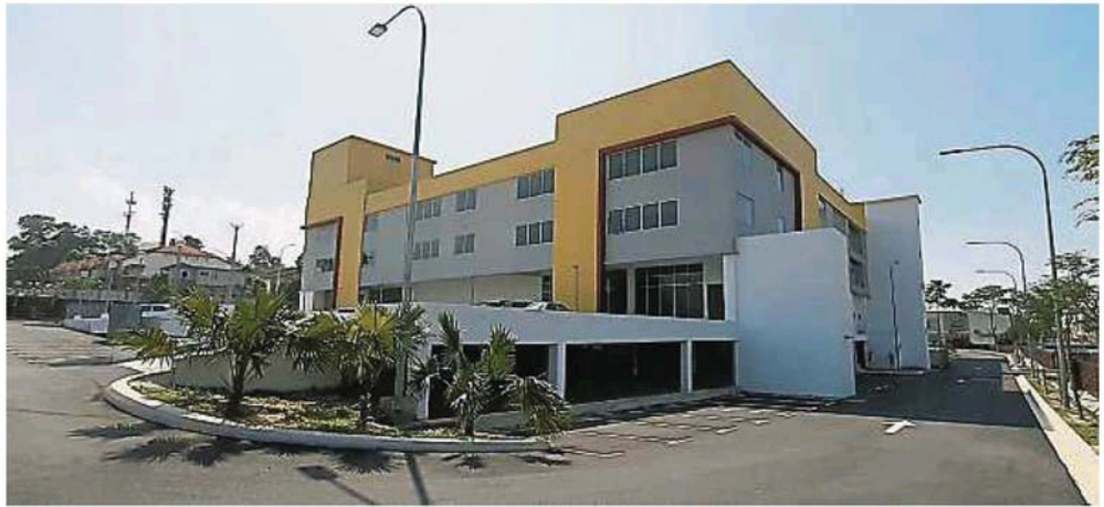
这栋结合商业及巴刹用途的“皇冠城中环”工程接近尾声，预计明年初正式启用。

加影市议会执照组今早在“皇冠城中环”与来自蕉赖皇冠城第八区及双溪龙镇的早市巴刹共44名持有执照的猪肉贩、鸡肉贩、鱼贩及菜贩等进行面试，大部分收到通知的小贩都有出席。