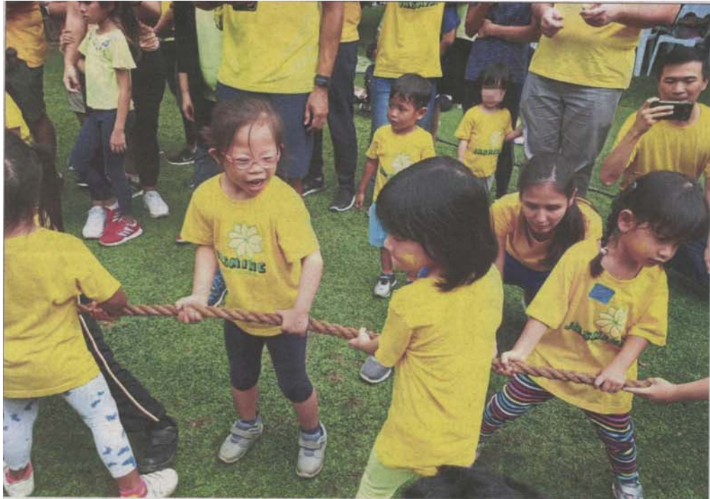
MTOS is eager to provide an inclusive learning environment for disabled children.

Provided for client's internal research purposes only. May not be further copied, distributed, sold or published in any form without the prior consent of the copyright owner.