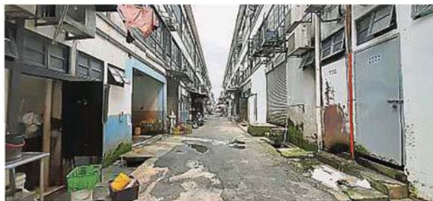
沟渠里长年累月堆积的油污和泥沙，影响排水功能。