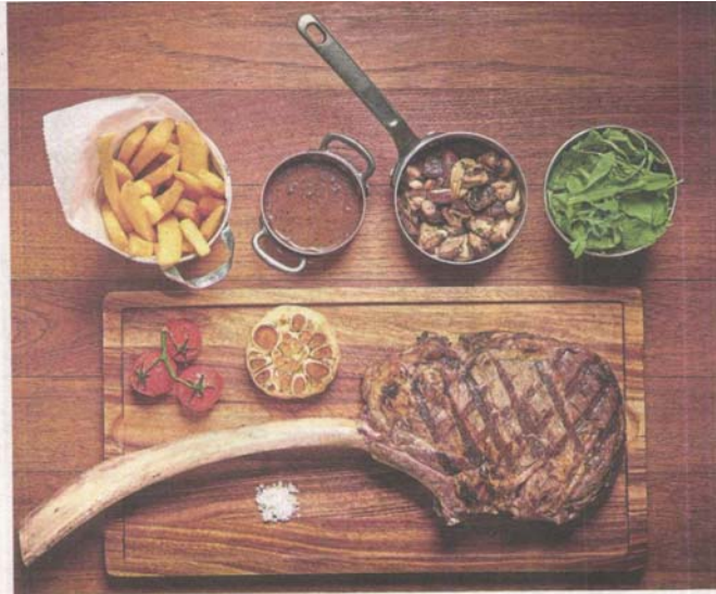
The tomahawk rib-eye served with steak fries, grilled mushrooms and arugula can be shared among four diners.

Provided for client's internal research purposes only. May not be further copied, distributed, sold or published in any form without the prior consent of the copyright owner.