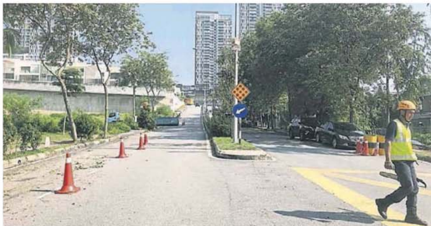
■靠近苏特拉高原的上半段道路，仍未移交给加影市议会管理。

他随后也要求加影市议会，修砍主要道路两旁阻碍驾驶人士视线的树木，包括道路分界堤上的野树。