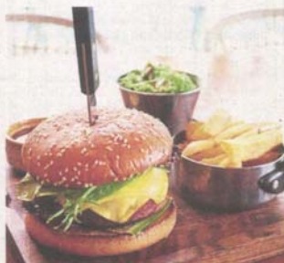
Vegetarians can try the meatless burger served with dairy-free cheese, mayonnaise and pickles.

This is the writer's personal observation and is not an endorsement by StarMetro.