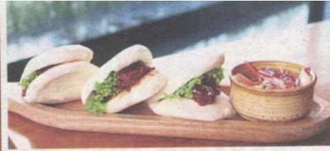
The sliders with tender beef brisket in steamed bun is appetising.

Those who prefer a fusion of Western and Asian can savour the Salmon Asam