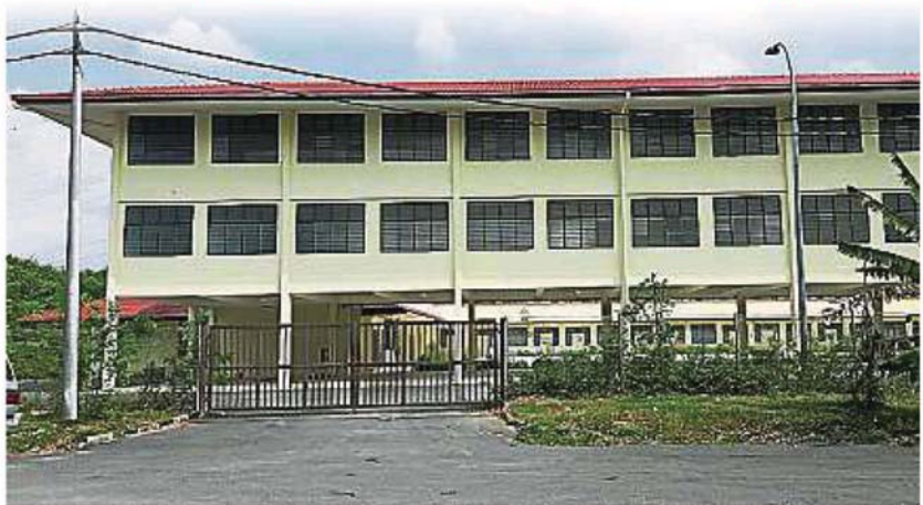
家长和华社关心新城华小能否在明年开课。

他促请郑耀民让出建委会主席一职，让有心为新城华小，为华社好的人士代劳，促成新城华小早日开课的事实。