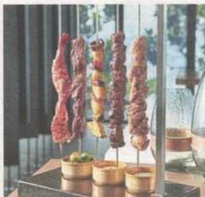
Explore the taste of beef teriyaki, chicken lemongrass, shrimp tikka, spiced lamb and grilled vegetables at the restaurant.